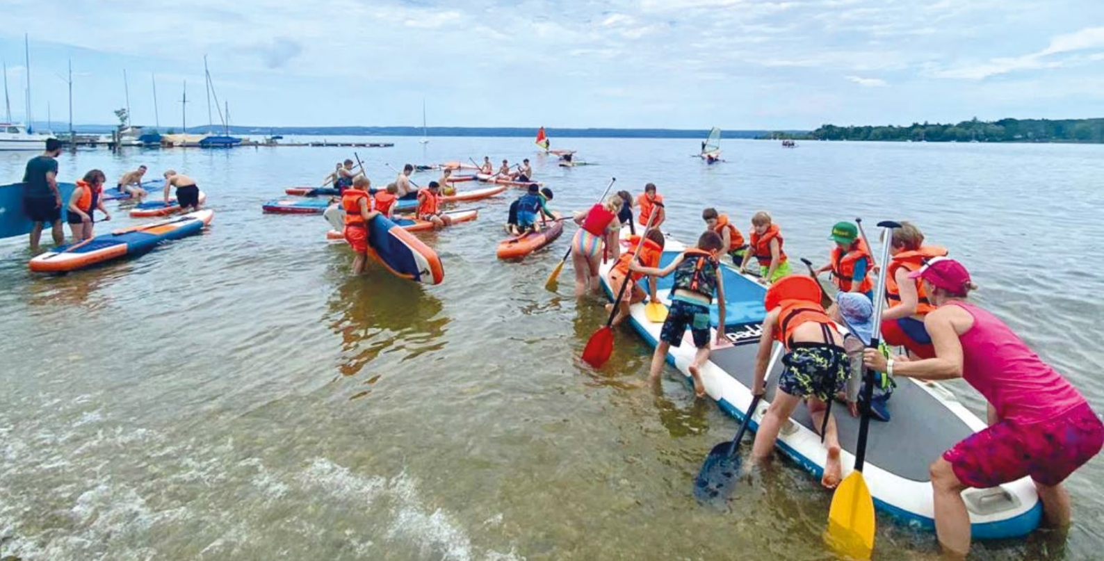
Die ganze Klasse ab aufs SUP-Board am Wikiwakiwu – SUP und Windsurf Verleih in Herrsching am Ammersee