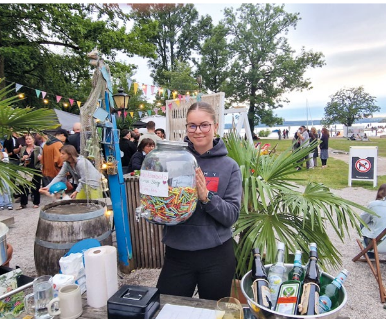
In der Spendentombola befanden sich neben vielen großen- und kleinen Preisen auch Nieten.