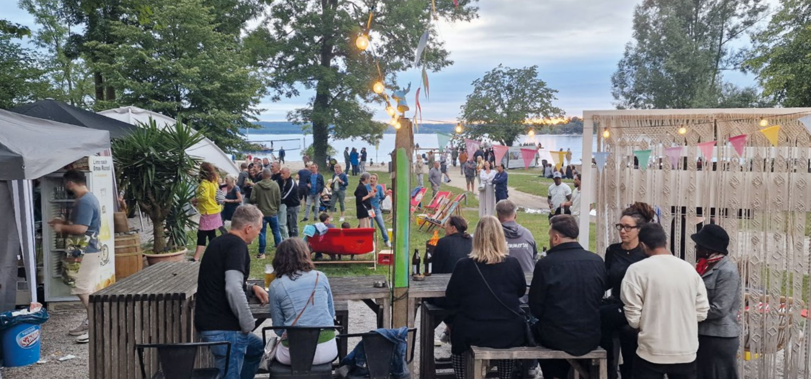
Ausgelassene Stimmung herrschte bei der ersten Spenden Beachparty am Steg 1.