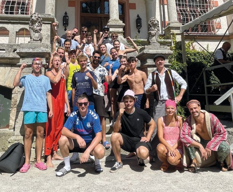
Die Kandidaten fürs Fischerstechen