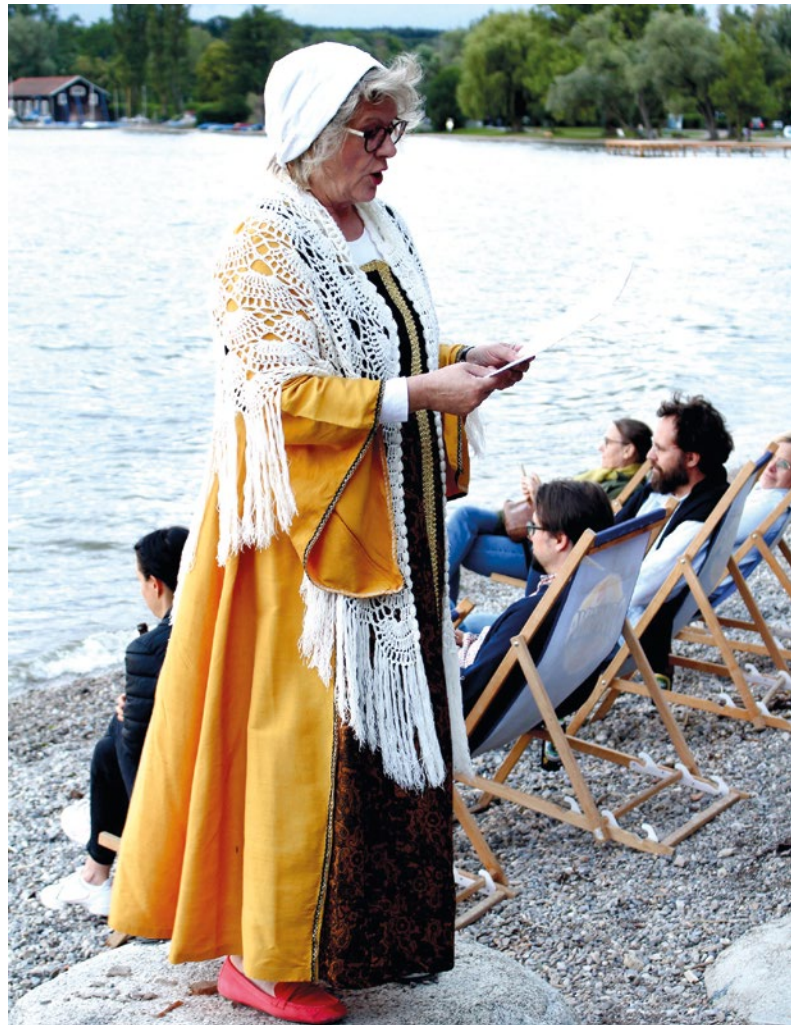
Mit der traurigen Liebesgeschichte vom Waller und der kleinen Bierjungfrau endete der Spaziergang.

In der ehemaligen Bäckerei Kößler gab es damals das vermutlich erste öffentliche „Public Viewing“ in Herrsching: Während der Fußball WM 1954 wurde die Backstube leergeäumt und ein Fernseher hineingestellt, so dass das WM-Finale von Bern gemeinsam angeschaut werden konnte. Später waren dort das