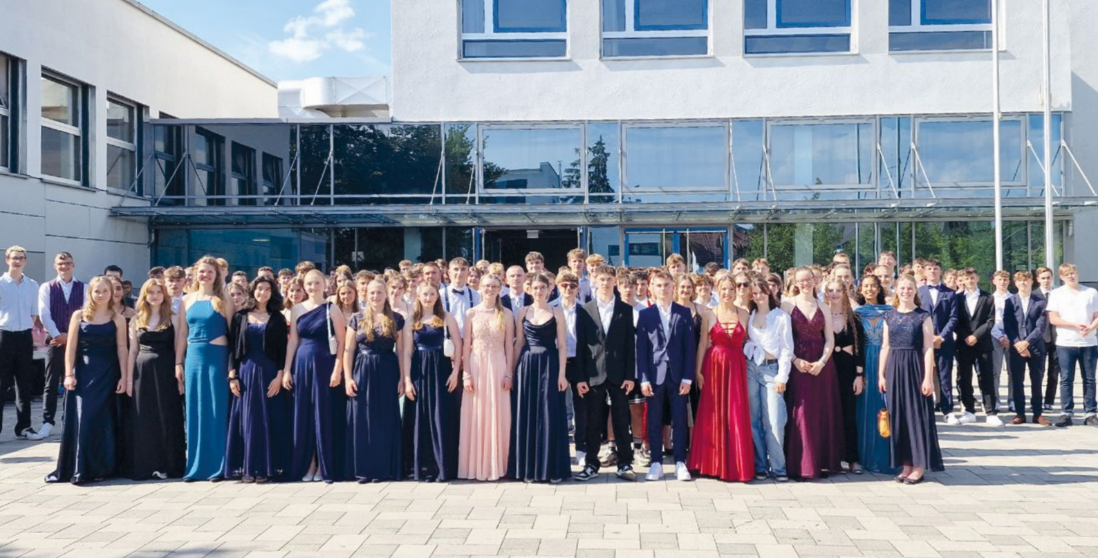
Vorfreude: Alle 178 Absolventen der Staatlichen Realschule Herrsching vor der feierlichen Zeugnisübergabe