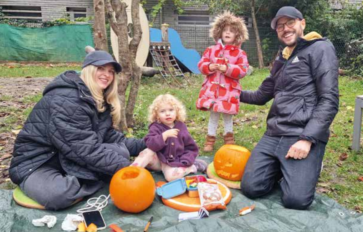
Das Kürbisschnitzen im Familienzentrum hat Tradition. Fast immer konnte die Aktion im Garten stattfinden.