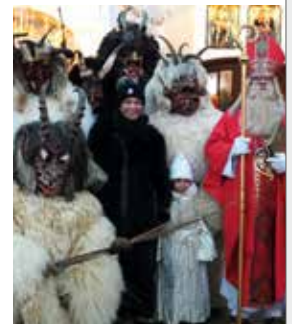
Der Nikolaus und seine Krampusse besuchen uns am Sonntag, 24.11. im POST-Biergarten

So geht's: Packt nützliche Kleinigkeiten (z.B. Kaffee, Tee, Honig, Marmelade, Wasch- oder Spülmittel, Duschgel, Zahnpasta und -bürste, Nudeln, Müsli, Konserven, Kekse, Schokolade, Bonbons, Socken ... alles, was haltbar ist) in einen hübsch dekorierten Schuhkarton und gebt diesen bis zum 23.12.24 bei uns in der POST in Herrsching ab. Wir sammeln alle Kartons und bringen eure Geschenke an Weihnachten zur Herrschinger Tafel.