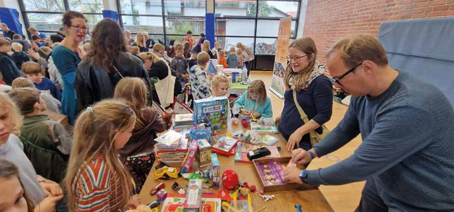
Viele Spielsachen und Bücher fanden in der Martinshalle neue, glückliche Besitzer.