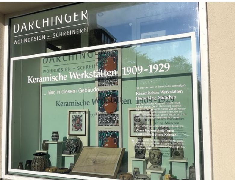
Schaufensterausstellung zu den Keramischen Werkstätten Herrsching in der Keramikstraße Herrsching an der Promenade am Ammersee.

anderem keramische Gefäße und Bierkrüge mit Jugendstilornamenten. Seine Arbeiten verdeutlichen, wie eng Architektur, Möbeldesign und Keramikkunst zu dieser Zeit miteinander verflochten waren.