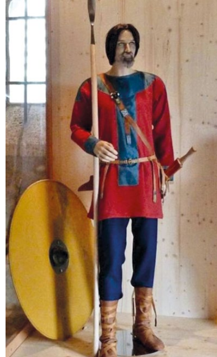
Rekonstruierter Krieger aus Grab 9 in der Ausstellung Herrschinger Adelskirche