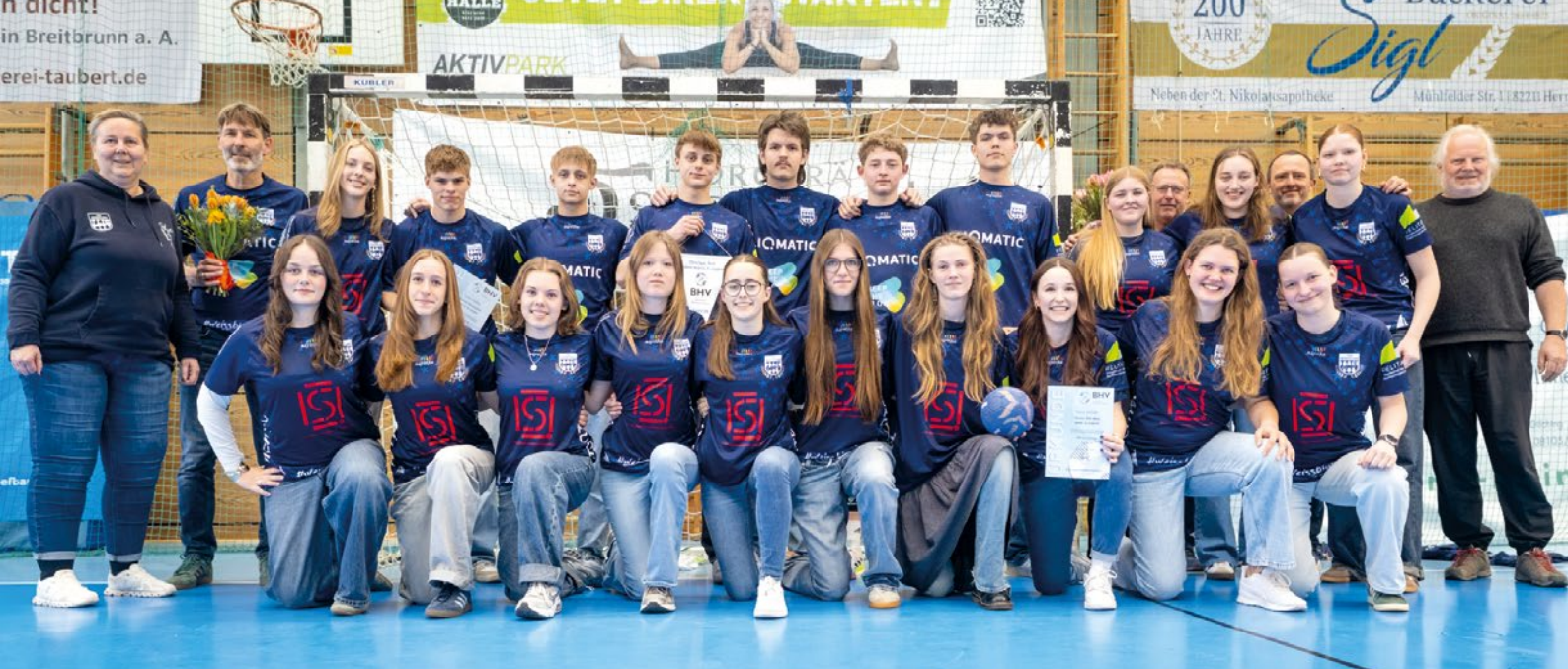
Weibliche und männliche A-Jugend