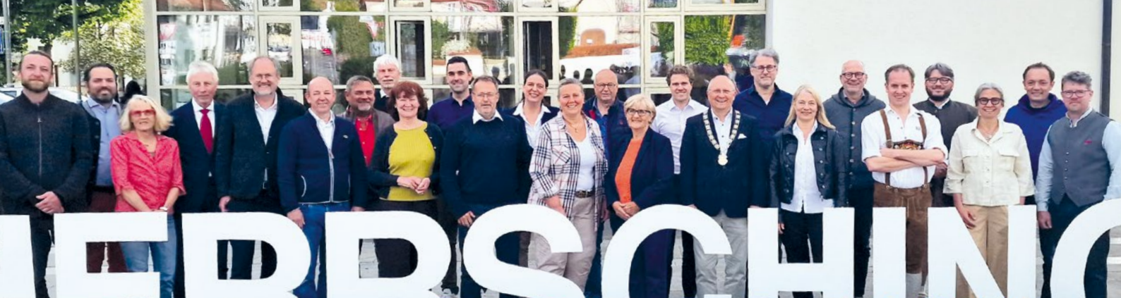
Das ist der neue Gemeinderat 2026