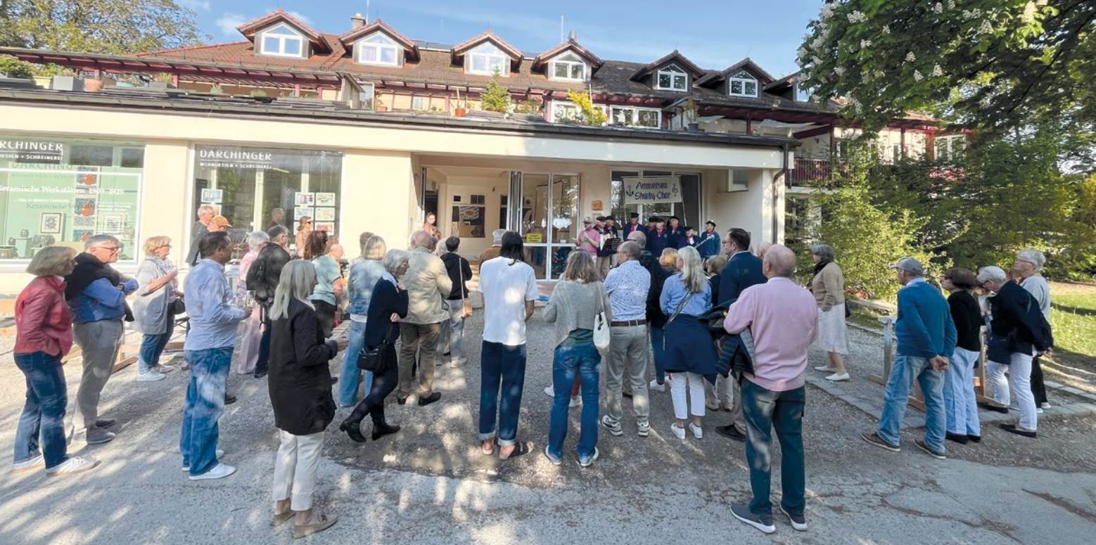
Der Gesang des Shanty Chors Ammersee anlässlich der Eröffnung der Schaufensterausstellung „Keramische Werkstätten Herrsching“ in der Schreinerei Darching in der Keramikstraße lud einige interessierte Passanten zum Verweilen ein.