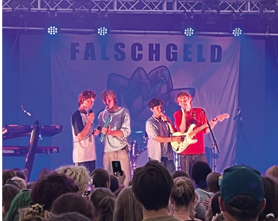
Ausgelassene Partystimmung bei den zahlreichen Besuchern ab Minute eins: „Falschgeld“ sorgte am letzten Abend im Festzelt für beste Unterhaltung für alle Generationen.