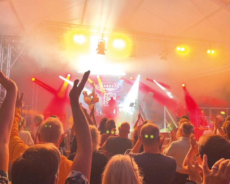
Das begeisterte Publikum tanzt und feiert vier volle Stunden mit HARDY'S BAND auf der Festzeltbühne in Herrsching.