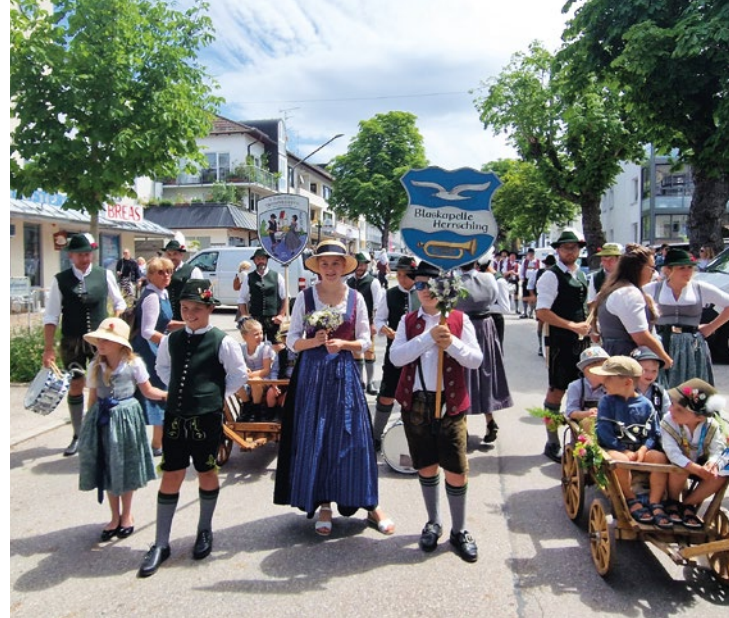
Ein Festzug der Superlative mit allen Vereinen und Institutionen der Gemeinde Herrsching. Hier bei der Aufstellung, allen voran die Blaskapelle Herrsching.