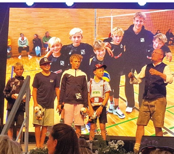
Die Volleyballer U12 und die Herren 2 wurden für ihre Aufstiege geehrt.