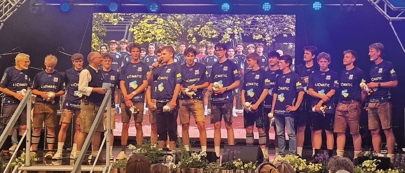
Die Meister der Oberliga im Handball: Die Herren der A-Jugend wurden für ihren Aufstieg von der Regional- in die Bayernliga beglückwünscht.