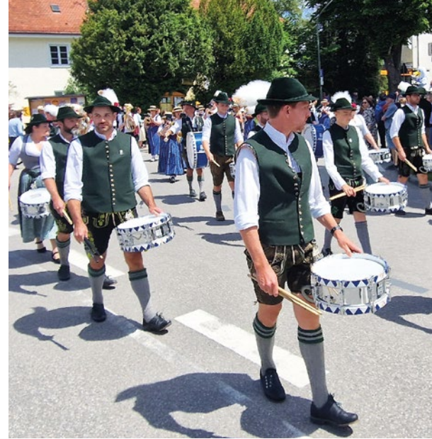
Die Trommler vom Aubachtaler Trommlerzug Hechendorf gaben den Takt an.

Ausstellung in der Adelskirche informiert anschaulich über die Vor- und Frühgeschichte Herrschings und ist bis Ende September jeweils sonntags geöffnet.