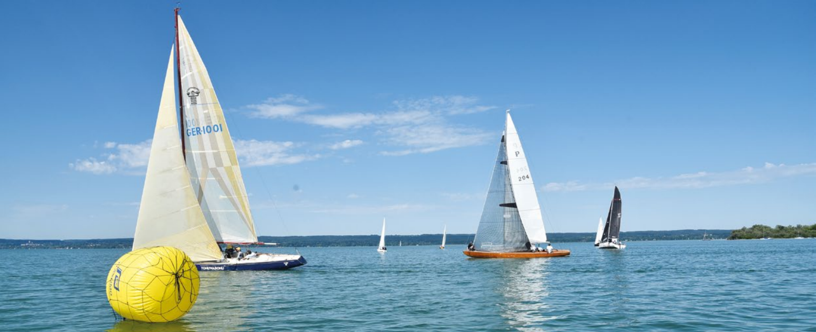
Der Nationale Kreuzer „Thimalus“ (Mitte) am Start.